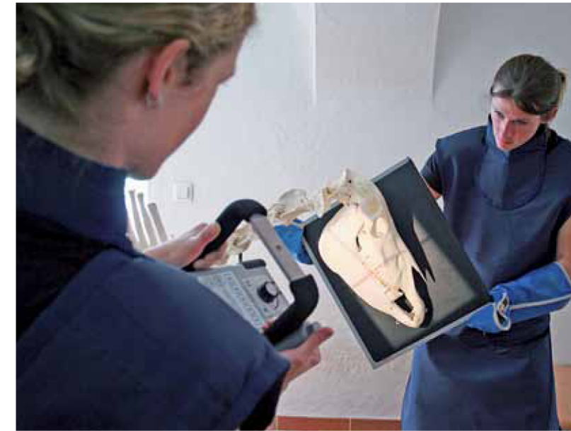
Sämtliche medizinische Apparaturen, wie hier das Röntgengerät, können mobil eingesetzt werden.

Schulmedizin plus komplementäre Medizin – für das Pferd das Beste aus beiden Welten